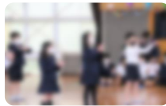
各学年からの出し物