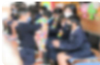
6年生へのプレゼント渡し