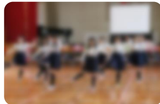
6年生からの出し物