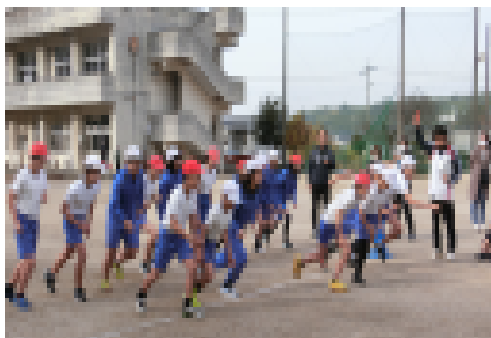
【5・6年生スタートの様子】

12月6日（水）に持久走記録会を行いました。これは、持久力を高めるとともに、目標を持って練習に取り組む態度や日頃から運動に親しむことをねらいとして毎年取り組んでいます。