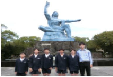
【平和祈念像の前で】